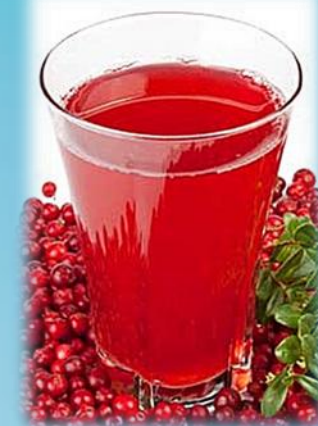
Морс из ягод