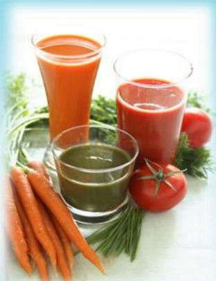
Натуральные соки фруктов и овощей